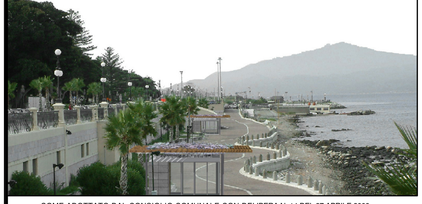
COME ADOTTATO DAL CONSIGLIO COMUNALE CON DELIBERA N. 14 DEL 27 APRILE 2009 (* ) COMPRESO DEGLI EMENDAMENTI