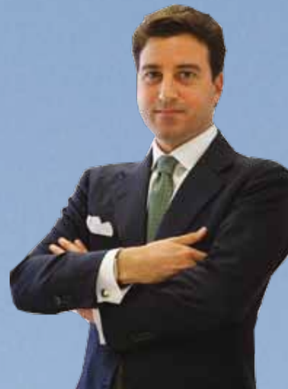
Fabrizio Capua Assessore Regione Calabria

A 15 anni dalla Dichiarazione di Barcellona, la necessità di rendere effettivamente operativa una zona di interscambio economico-commerciale tra le due rive del Mediterraneo è divenuta sempre più prioritaria. In questo scenario la Calabria, per ragioni storiche, geografiche ed economiche, è chiamata a svolgere un ruolo da protagonista che la metta in grado, sfruttando le proprie intrinseche potenzialità, di intercettare le concrete opportunità che possono derivare dal processo di cooperazione euro-mediterranea, consentendole con ciò di diventare un vero e proprio punto di riferimento nel Mediterraneo, non solo per l'Italia, ma per lo stesso continente europeo.