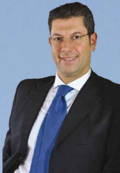
Giuseppe Scopelliti Presidente Regione Calabria

L a 1ª Conferenza Regionale sulla Cooperazione Internazionale e le Attività di Partenariato della Regione Calabria rappresenta una grande sfida per il rilancio della nostra regione nell'area euro mediterranea e un momento importante nel quale avviare un dialogo costruttivo. Dialogo che deve prevedere azioni sinergiche di collaborazione tra i paesi dell'Unione Europea e il partenariato mediterraneo, per contribuire ad una più concreta cooperazione euro-mediterranea al fine di rispondere alle sfide della globalizzazione e della crisi economica nel mondo.