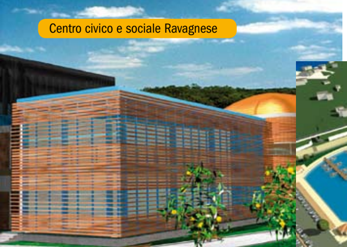
Centro civico e sociale Ravagnese

La città si proietta verso un futuro che può essere certo quanto più consapevole è la conoscenza della nostra realtà e delle nostre possibilità di pianta che germoglia e offre i suoi frutti al Turismo, alla Cultura, all'Arte, al Senso Civico. Reggio mira a diventare un polo attrattivo del Mediterraneo grazie alle potenzialità territoriali a lei consone e alla valorizzazione integrata delle sue risorse. Archeologia, storia, cultura sono tutti elementi che convergono al rafforzamento della vocazione turistica, ma una città che si pone grandi obiettivi deve iniziare a dotarsi anche di strutture atte alla soddisfazione di ogni esigenza di chi vive e soggiorna al suo interno, e perché le intenzioni non restino tali e si trasformino in realtà tutti siamo chiamati a dare il nostro piccolo contributo alla crescita armonica dell'ambiente nel quale viviamo.