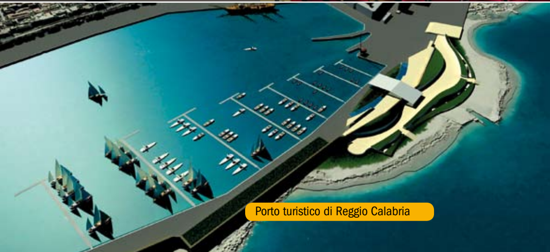
Porto turistico di Reggio Calabria