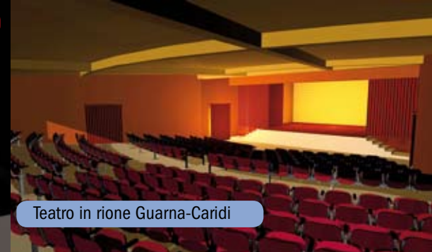
Teatro in rione Guarna-Caridi