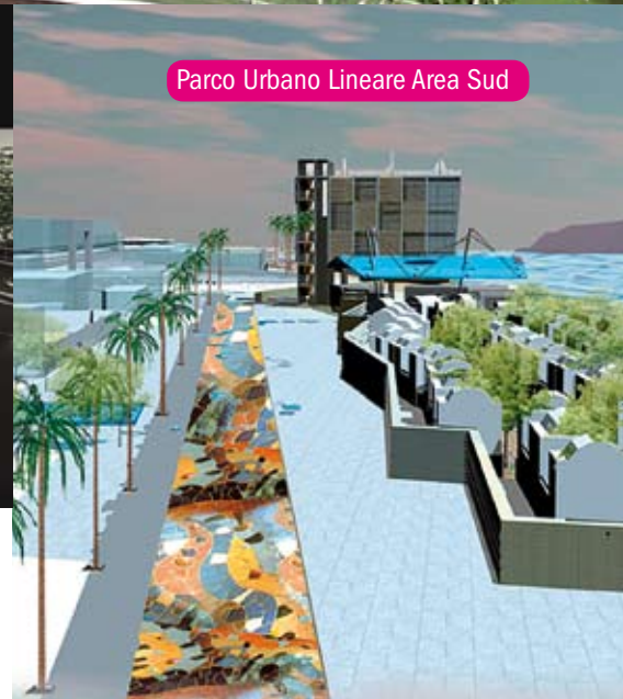
Parco Urbano Lineare Area Sud