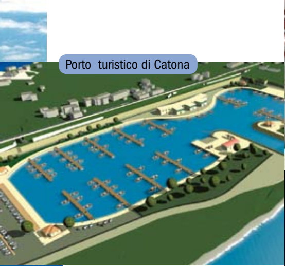
Porto turistico di Catona