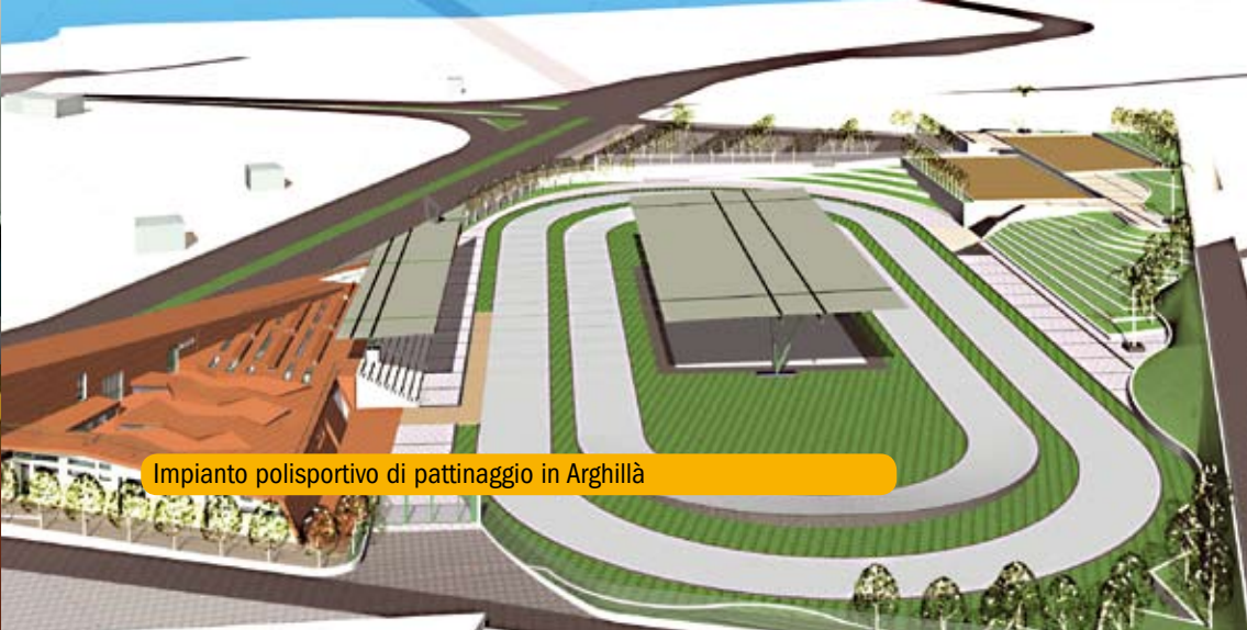
Impianto polisportivo di pattinaggio in Arghilla