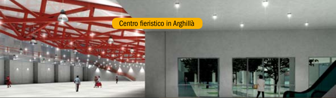
Centro fieristico in Arghilla