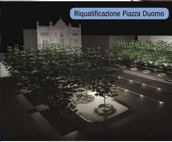
Riqualificazione Piazza Duomo