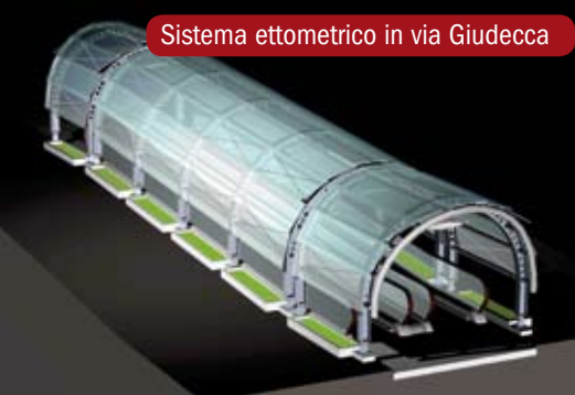
Sistema ettometrico in via Giudecca