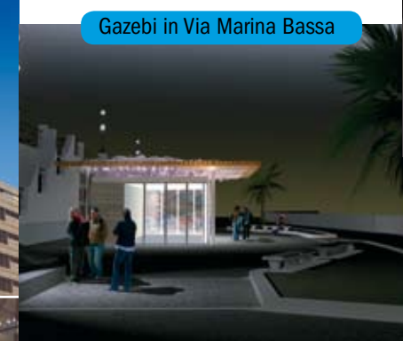
Gazebo in Via Marina Bassa