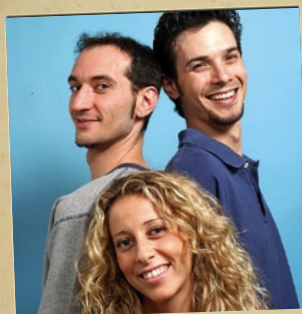
I MANCIO E STIGMA FenisRide - Fenis (Aosta)