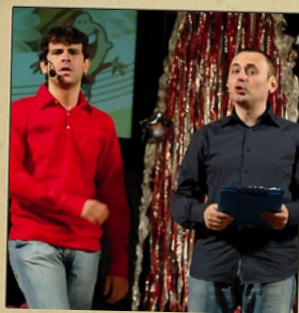
DUO TORRI Locomix - Repubblica di San Marino