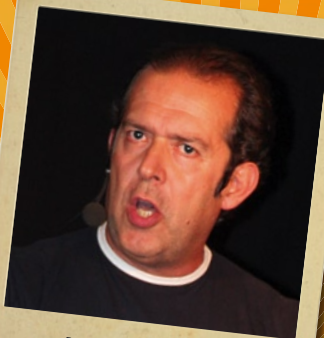
ITALO GIGLIOLI Festival La Lisca - Genova