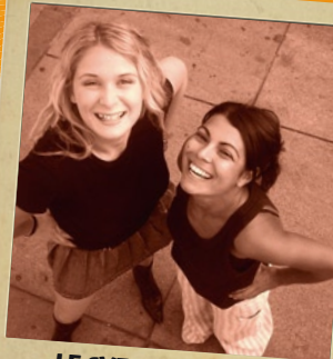
LE SVEGLIE SPENTE Concorso Città di Sesto S. Giovanni Milano