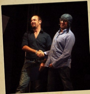
PAPA / LAUDADIO Avanti il prossimo - Sambuceto (Chieti)