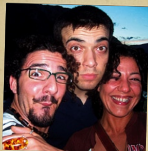
I SOLITI SOGGETTI Festival del cabaret di Manciano Grosseto