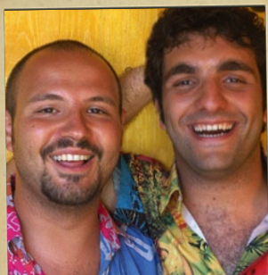
GLI SCIAGATTORI Off Limitz - Aulla (Massa Carrara)