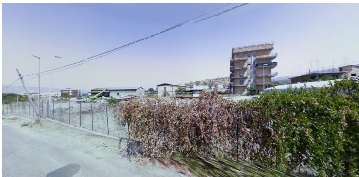
Pellaro San Giovanni