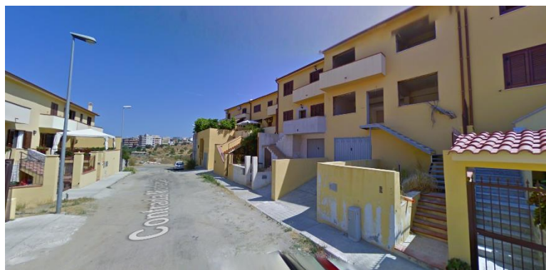
Gallina Contrada Morloquio