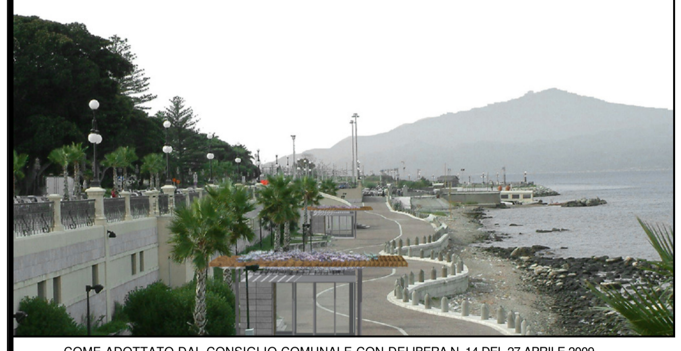
COME ADOTTATO DAL CONSIGLIO COMUNALE CON DELIBERA N. 14 DEL 27 APRILE 2009 (*) COMPRESO DEGLI EMENDAMENTI