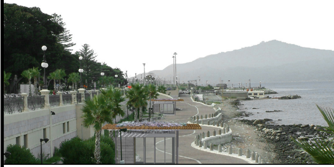
COME ADOTTATO DAL CONSIGLIO COMUNALE CON DELIBERA N. 14 DEL 27 APRILE 2009 (* ) COMPRESO DEGLI EMENDAMENTI