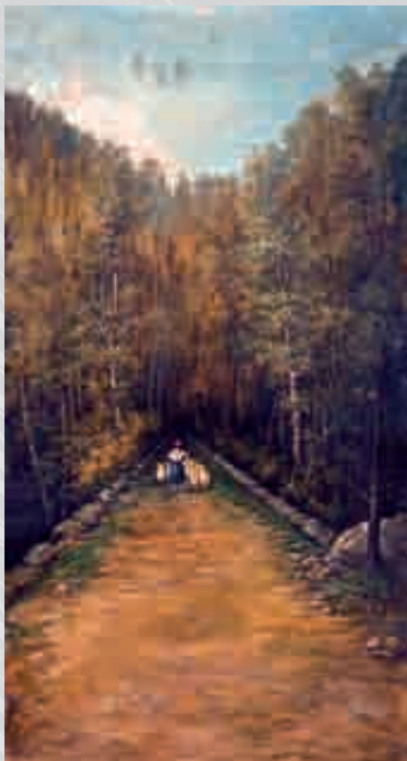
TOMMASO VITRIOLI Bosco con pastorella olio su tela, cm 63x35