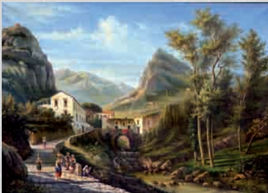
ANNUNZIATO VITRIOLI Paesaggio montano con ponte olio su tela, cm 73x99