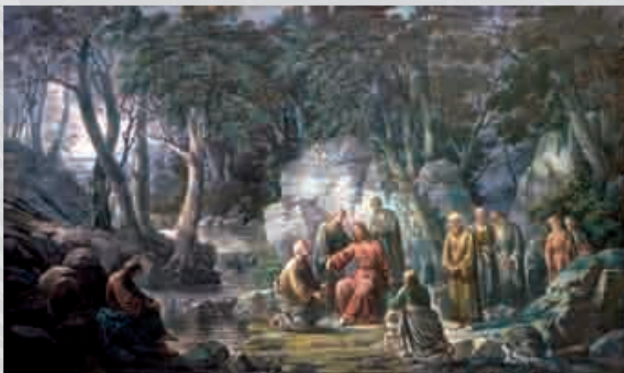
ANNUNZIATO VITRIOLI Cristo sull'orto olio su tela, cm 169x210