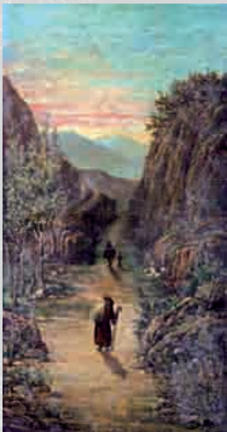
TOMMASO VITRIOLI Strada con vecchio olio su tela, cm 24x13