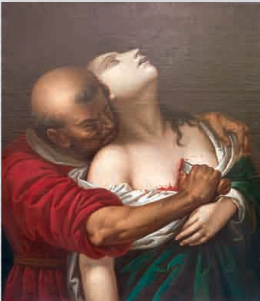
ANNUNZIATO VITRIOLI Martirio di S. Agnese olio su tela, cm 98x78