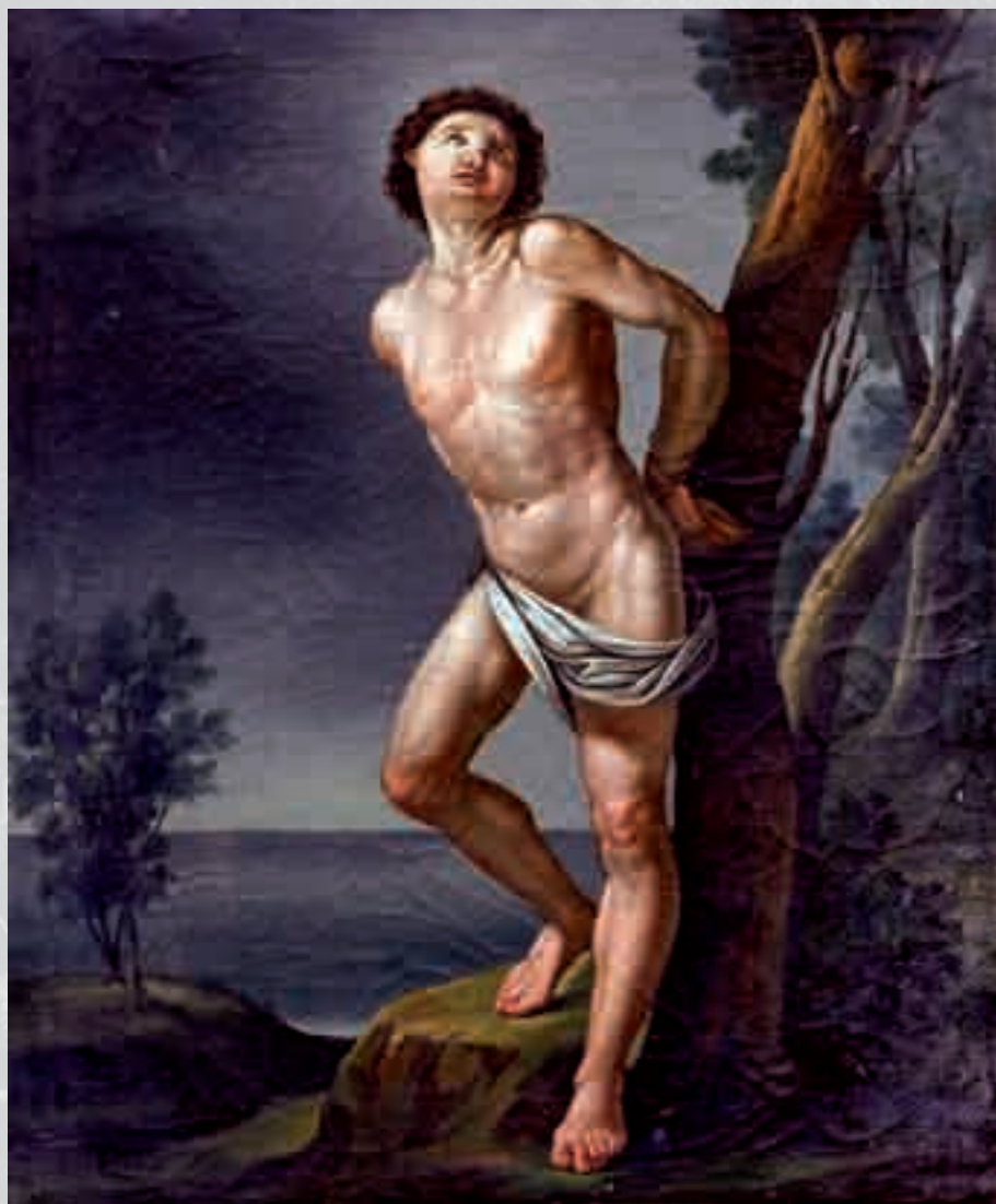
ANNUNZIATO VITRIOLI San Sebastiano olio su tela, cm 89x65