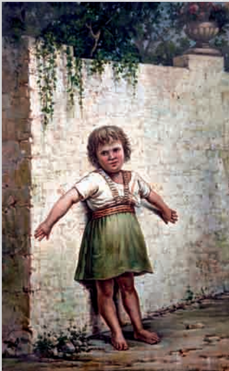
TOMMASO VITRIOLI Bimba olio su tavola, cm 36x22