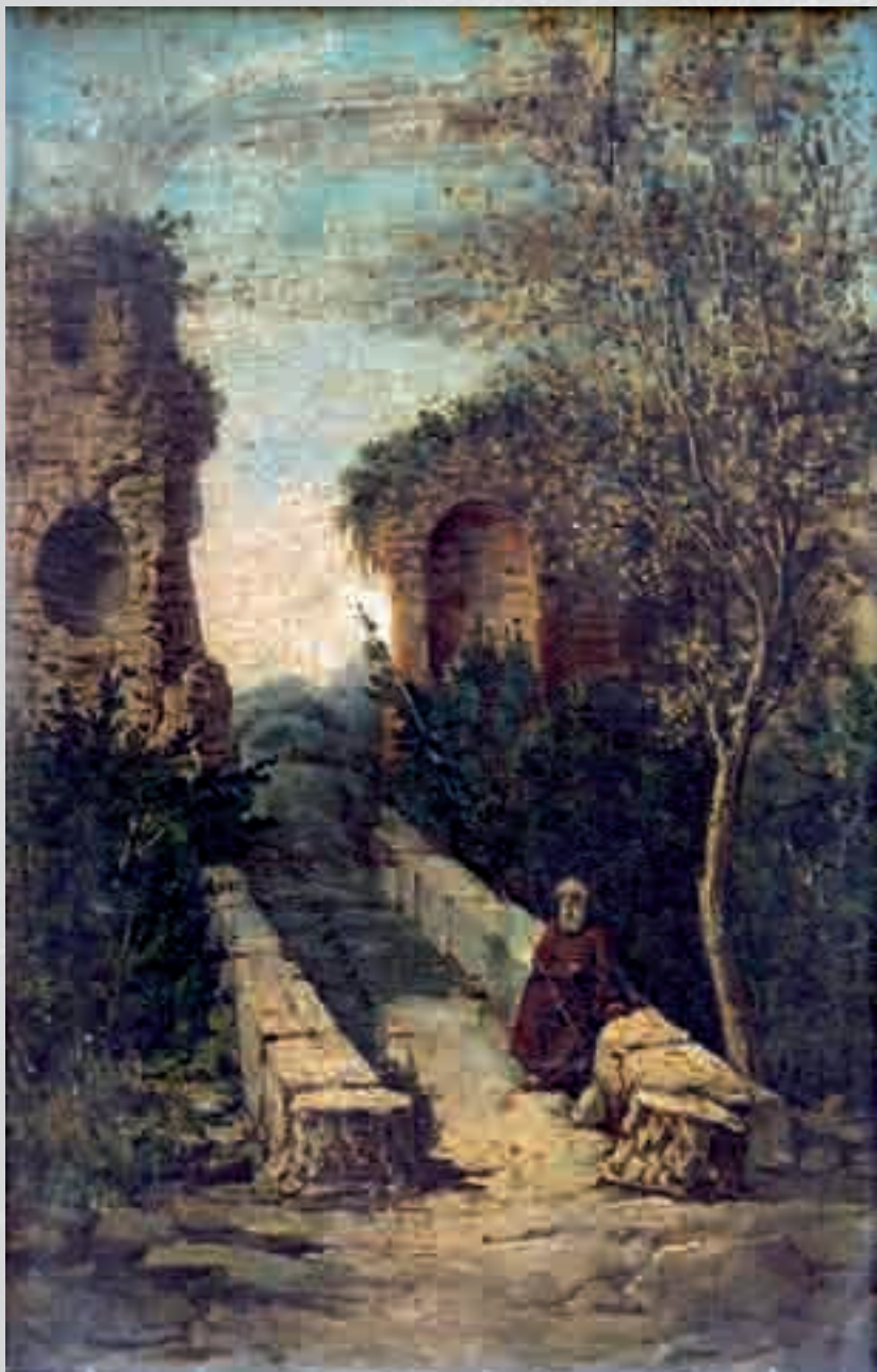
TOMMASO VITRIOLI Vecchio su strada olio su tavola, cm 23x14